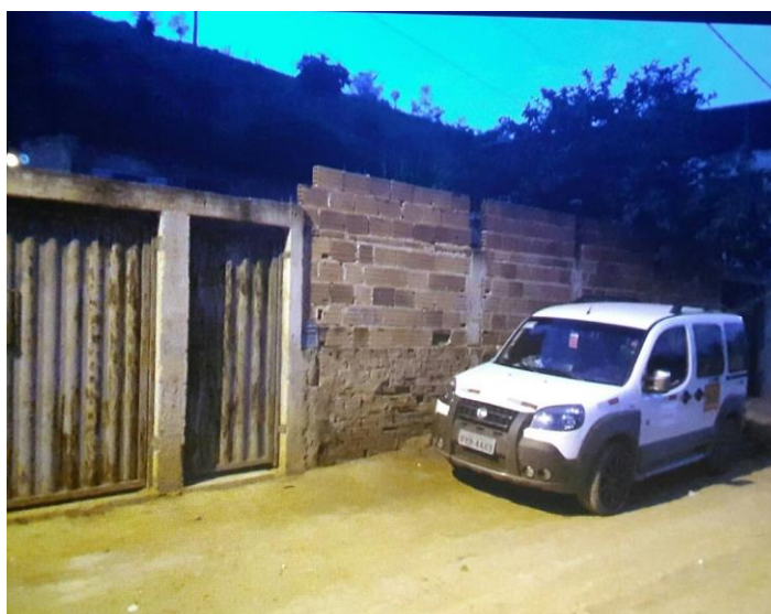
Figura 1. Registro fotográfico da visita.

No dia 29/05/2017, foi realizado contato telefônico, porém, sem êxito nas tentativas. No dia 10/06/2017, equipe técnica da empresa Synergia, enviou SMS para os números declarados pelo manifestante, com o objetivo que a família entre em contato com a empresa para realização do Cadastro Integrado. No mesmo dia equipe esteve no local declarado pelo manifestante, porém o mesmo não foi localizado no endereço informado.